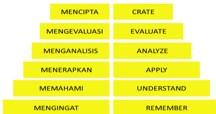
Gambar 2. Taksonomi Domain Kognitif Revisi Versi Anderson

Pada tahun 2001 Anderson et al., merevisi taksonomi Bloom karena mencerminkan bentuk berfikir yang berbeda, yang merupakan proses aktif yang membutuhkan kata kerja yang lebih akurat. Adapun enam pembagian yang ditawarkan oleh Anderson antara lain, mengingat ( Remember ), memahami ( Understand ), menerapkan ( Apply ), menganalisis ( Analyze ), mengevaluasi ( Evaluate ), dan mencipta ( Create ) (Anderson et al. 2001:30). Subkategori dari enam kategori utama digantikan oleh kata kerja, dan beberapa subkategori disusun ulang. Istilah pengetahuan diganti dengan istilah mengingat, karena pengetahuan adalah produk sedangkan istilah mengingat lebih mencerminkan proses berfikir. Hal yang sama dengan sintesis yang diganti dengan istilah mencipta ( create ). Hal yang lain yang direvisi adalah adanya penyusunan ulang, dalam taksonomi yang telah direvisi, mencipta dianggap sebagai proses berfikir yang membutuhkan mental operasional yang paling tinggi. (Hidayat et al. 2023:48)