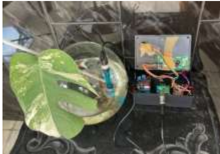
Tampilan Alat Secara Saat Terpasang Di Dekat Tanaman

menggabungkan beberapa komponen perangkat keras (hardware) yang saling terintegrasi dan mampu mengirimkan data secara real-time ke platform pemantauan berbasis cloud, yaitu Thinger.io dan Gmail.