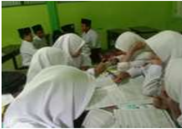
Gambar.1 penataan ruang kelas untuk diskusi.

Beliau juga menegaskan bahwa perbedaan dalam aspek pengaturan ruang kelas tersebut, dikarenakan karakteristik setiap kelas yang berbeda pula. Artinya, pendidik harus memahami sifat dan karakter yang dimiliki peserta didik. Sehingga harapannya peserta didik tidak merasa dikucilkan dan tidak pula merasa dirinya bodoh. Pendidik harus senantiasa bisa menjadi pendidik yang bersahabat.