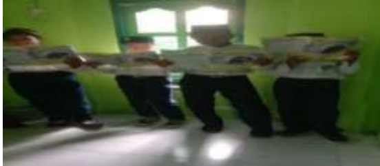
Gambar 3. pelaksanaan Active Learning

berkaitan dengan pelaksanaannya dimana penulis fokusna pada pembelajaran PAI kelas VII semester II dokumtasi dan wawancara sementara 2 lainnya dengan Untuk tema pertama.