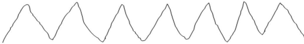
Ketujuh Motif Pola Diamond, merupakan motif geometris berbentuk seperti mutiara