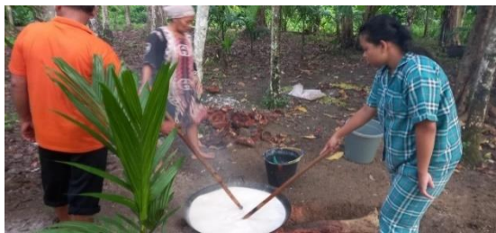
Gambar 2. Proses pembuatan Alame