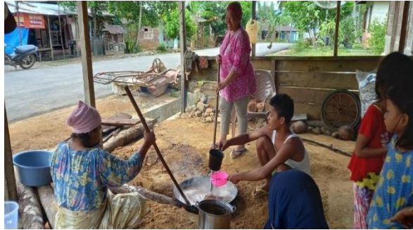
Gambar 1. Mangalame

Desa Galanggang Kecamatan Batang Onang belum ada yang bisa memaparkan kapan dan bagaimana tradisi ini mulai muncul.