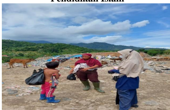
Gambar 3. Wawancara dengan anak Pemulung dan orang tua