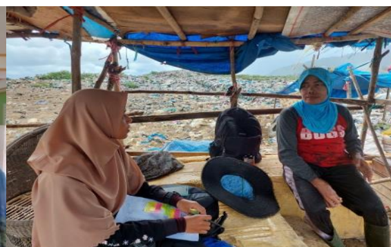
Gambar 2. Wawancara dengan orang tua