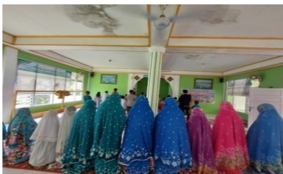
Gambar 1. Proses Mendapatkan Pendidikan Islam