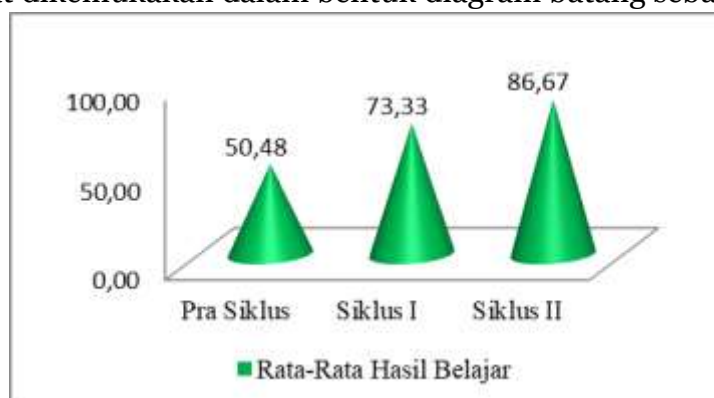
Gambar 2. Diagram Batang Rekapitulasi Peningkatan Hasil Belajar

Berdasarkan tabel hasil rekapitulasi peningkatan hasil belajar siswa di atas, selanjutnya dapat dikemukakan dalam bentuk diagram batang sebagai berikut: